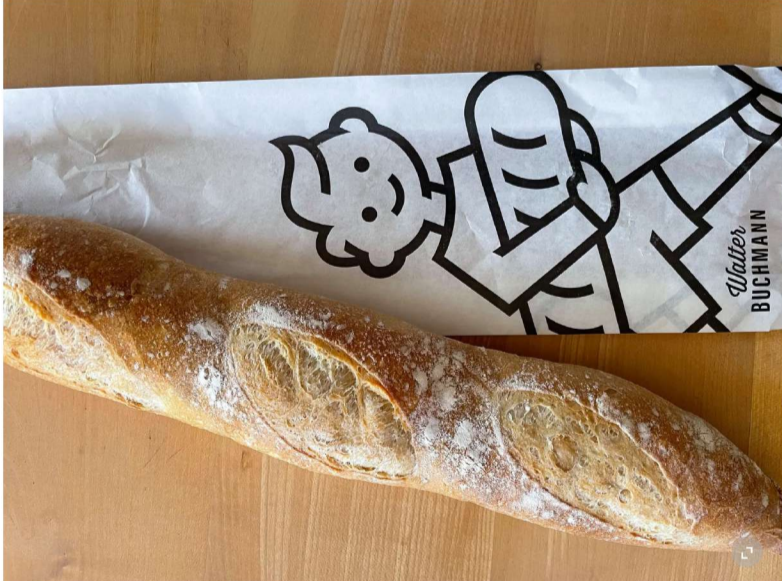
Macht gute Laune: Der Junge auf der Tüte der Bäckerei Buchmann.

Seit vielen Jahren trägt der kleine Bub mit der Haartolle, den kurzen Hosen und dem forschenden Schritt sein Brot nach Hause. Oder liefert er es auch? Wir wissen es nicht. Klar ist aber, ein Brötli aus diesem Walter-Buchmann-Papiersack macht instantan gute Laune.