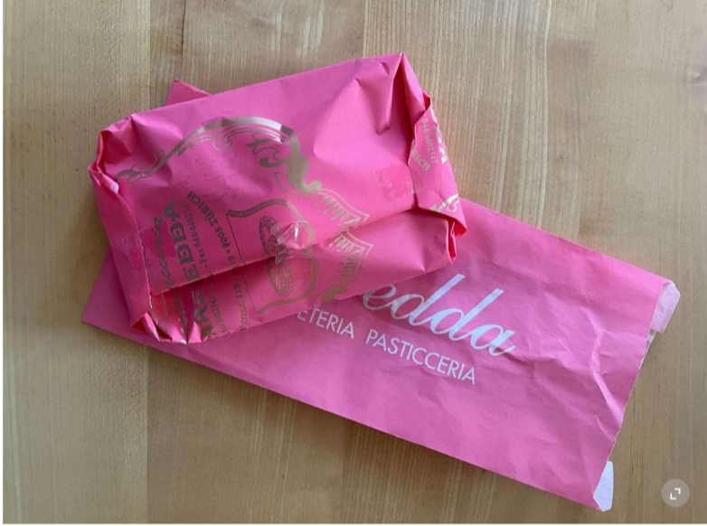
Lieblisch in Rosa, passend zum Sonntagsbrunch: Pasticceria Caredda.

Schon die rosa Verpackung verkündet: Hier ist etwas Edles drin. Stimmt, wir lassen uns am liebsten Sfogliatelle einpacken. Die aus Neapel stammende Spezialität besteht aus Blätterteig. Die Herstellung ist so aufwendig, dass wir dafür gerne in der Konditorei Caredda vorbeischaun, und wenn wir schon mal da sind, gleich noch auf einen Cappuccino bleiben.